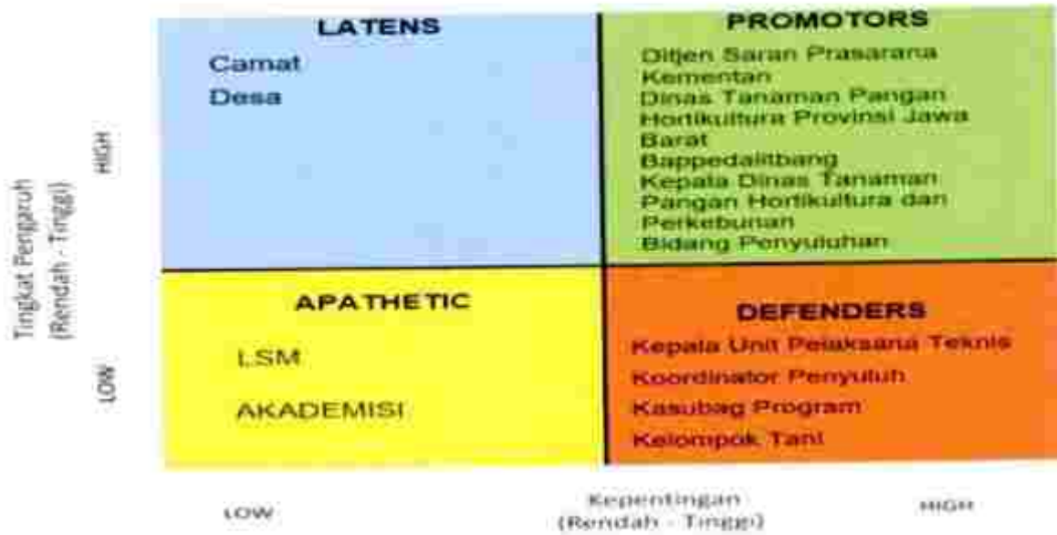
Gambar. Analisa Kolaborasi Pemangku Kepentingan (Mitra atau Stakeholders)

Keberadaan data dan informasi akan sangat berguna bagi para Pemangku Kepentingan ( stakeholders ) dalam keberlanjutan kinerja dan dalam mengambil keputusan mengenai pengelolaan sumber daya, khususnya dalam perencanaan arah pembangunan pertanian di Kabupaten Bogor.